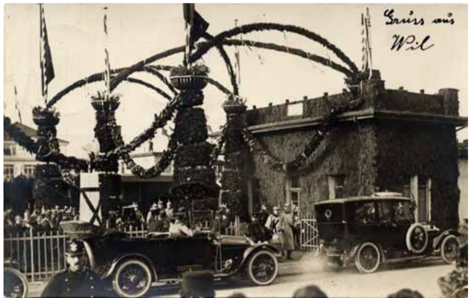
Der deutsche Kaiser Wilhelm II. am Bahnhof Wil 1912.

Störungen in den internationalen Märkten, eine zunehmende Kluft zwischen der umfangreichen Integration in den Weltmarkt und den Anforderungen an die eigene Versorgungssicherheit, sowie Befürch-