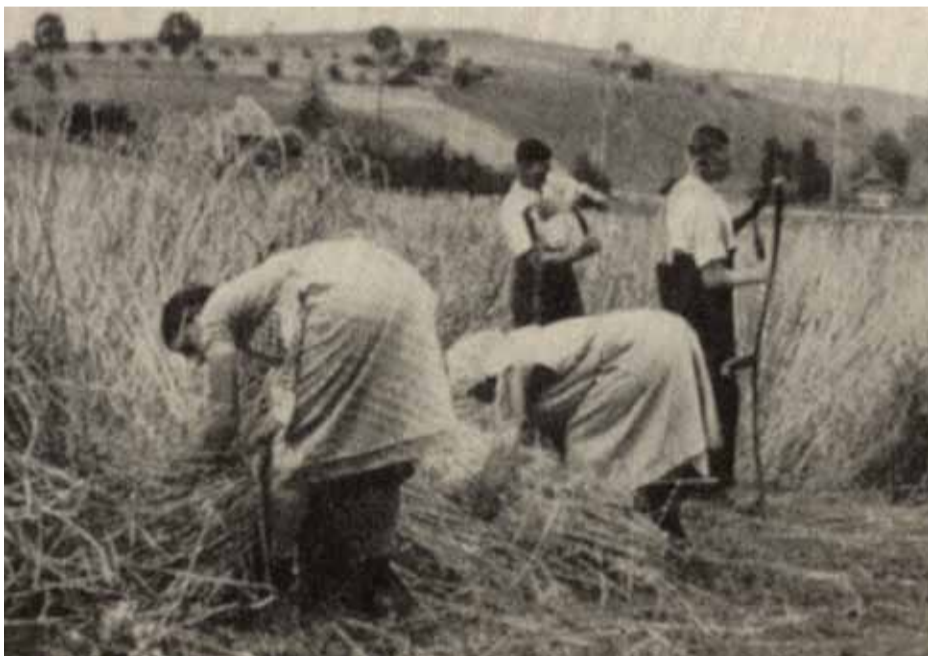
... wie auch sonst Handarbeit nötig war !

Als späte Konsequenz kaufte schliesslich das Militärdepartement im Jahr 1892 ausländisches Getreide für die Armee, das im Kriegsfall auch dem zivilen Konsum hätte zugeführt werden können.