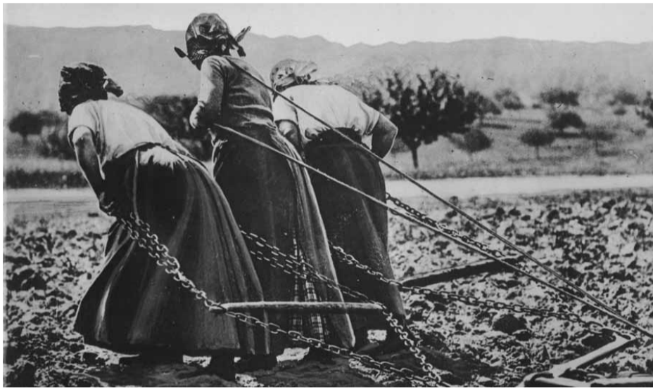
Fehlende Zugtiere müssen ersetzt werden...

erlebt, hinterliess die heikle Situation dennoch Spuren. So wurde kurz darauf versucht, die Vorräte des privaten Getreidehandels von der Grenze weg ins Landesinnere zu verlegen, um die Versorgung der Bevölkerung im Falle eines erneuten Krieges zu sichern. Unter anderem die fehlenden gesetzlichen Grundlagen verhinderten dies.