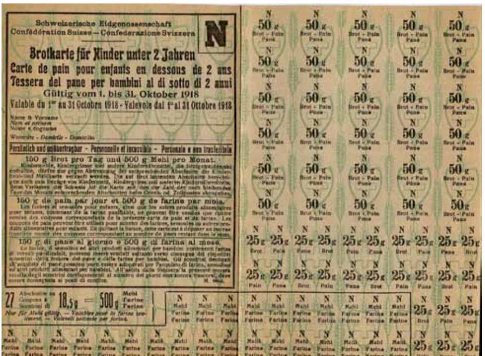
Erster Weltkrieg: Brotrationierungskarte.

tungen weiterer kriegerischer Handlungen stärkten in dieser Zeit den Ruf nach staatlicher Intervention und der Förderung des inländischen Getreideanbaus. Massgebliche strukturelle Veränderungen blieben dabei (noch) aus, letztlich legte der Bund aber auf Druck von aussen ab 1912 auch kleinere Vorräte direkt für die Zivilbevölkerung an. Nach der Gründung des