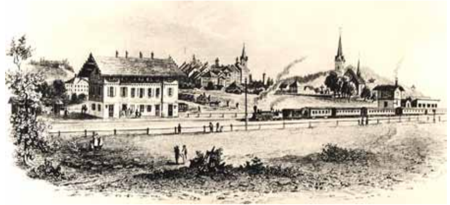
Bahnhof Wil nach 1855

ein Gut des Marktes. Die Entwicklung der Eisenbahn und der Schifffahrt förderte in der zweiten Hälfte des 19. Jahrhunderts die internationale Arbeitsteilung und verstärkte im Zuge der Industrialisierung